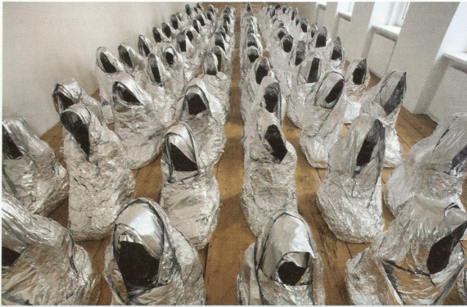
Kader Attia, "Ghost", 2007, papel de aluminio.

Las Tehran Prostitutes , obra de 2008 de la artista iraní Shirin Fakhim, son grotescas muñecas de tamaño natural, mujeres cosi-